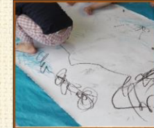
巨大シートお絵かき