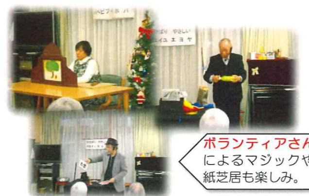
ボランティアさんによるマジックや紙芝居も楽しみ。