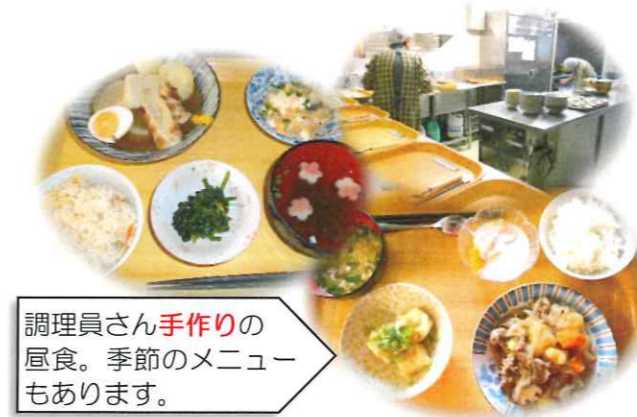
調理員さん手作りの昼食。季節のメニューもあります。