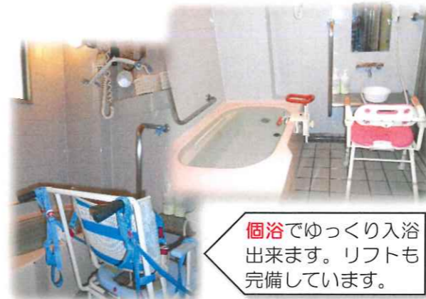
個室でゆっくり入浴出来ます。リフトも完備しています。

笑顔と歓声のレクリエーション、共同での作品制作、各々の趣味に合う個別手作業をしながら、家庭的なゆったりとした雰囲気の間を過ごしていただいております。ご利用者様の尊厳を守り自立に向けて安心・安全をモットーに職員一同ご利用をお待ちしております。地域のボランティアさんによる演奏、伝統芸能の披露、季節ごとのイベントも取り入れております。急な体調の変化がみられた場合には、看護師の判断のもと、ご家族様に連絡をし、主治医又は救急車対応を致します。ご家庭での体調やご様子の変化等がございましたら、細かい事でも、ご連絡をお願いしております。